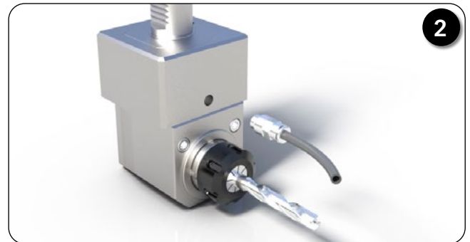
クーラントパイプ、ERナット、工具を取り外す