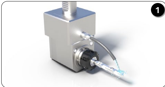
一般的な外部給油