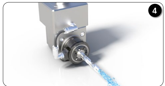
クーラントパイプを接続して内部給油化完了